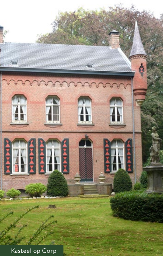
Kasteel op Gorp