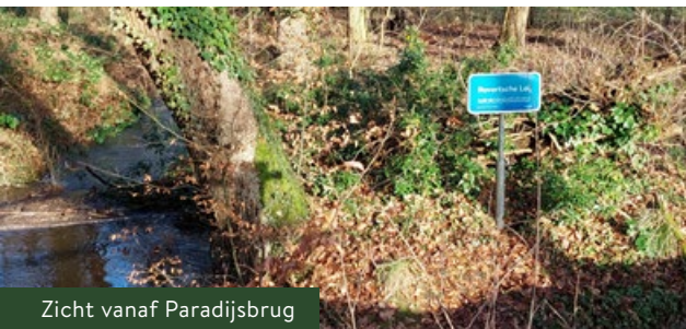
Zicht vanaf Paradijsbrug